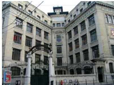
Le pôle Art Appliqué du lycée la Martinière-Diderot, 18 place Rimbaud, Lyon 1er

le diaporama de l'exposition "Usure et frottement" telle que montée au lycée la Martinière Terreaux et de son vernissage le 16 mars 2006